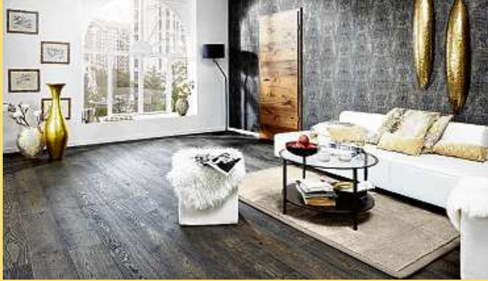
Naturholzböden geben jedem Raum eine natürliche Atmosphäre.

Nicht zuletzt wirke das natürliche Material Holz auch auf denjenigen ein, der damit arbeite: „Man entwickelt ein besonderes Gespür für den verantwortungsvollen Umgang mit der Natur und dafür, sie zu beschützen und zu bewahren“.